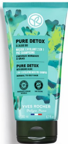
Maschera Esfoliante 2 in 1 Pre-Shampoo di Yves Rocher

Se i capelli sono grassi, attenzione a non appesantirli ulteriormente con maschere dalle texture troppo ricche. In questo caso, il problema riguarda maggiormente il cuoio capelluto e la sua eccessiva produzione di sebo che "sporca" e "unge" i capelli. A volte manifestando anche una leggera forfora .