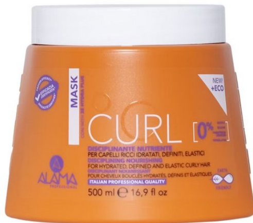
Curl Mask di Alama Professional

In alternativa, risultano perfette anche le maschere capelli ricci che uniscono critriolo emolliente (uno zucchero derivato dalla fermentazioni dei cereali) e olio di oliva elasticizzante . Come la Curl Mask di Alama Professional pensata per mantenere quanto più a lungo possibile l'idratazione e la flessibilità dei ricci.