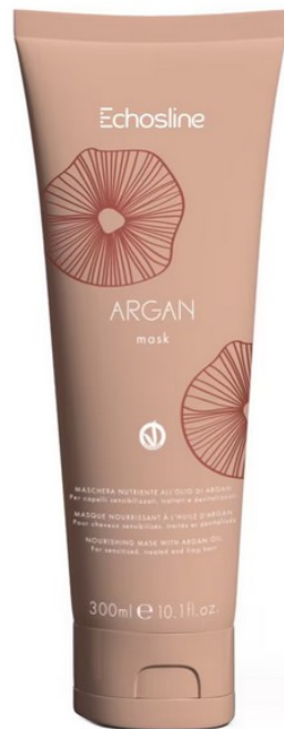
Argan Mask di Echosline

Anche i capelli crespi sono tipici della stagione autunnale; a volte, però, si presentano già in estate, magari al ritorno da una giornata in spiaggia, poiché la salsedine che tende a legarsi alla fibra capillare ha un'azione disidratante. Per scongiurare l'effetto paglia della chioma, servono - anche quotidianamente - maschere capelli crespi uomo a base di oli e burri vegetali . Uno su tutti l'olio di mandorle. «Questo si ottiene per spremitura a freddo dei semi del mandorlo» racconta Corinna Rigoni , presidente di Donne Dermatologhe Italia «ed è ricco di acido oleico e linoleico dalle virtù ristrutturanti ed elasticizzanti».