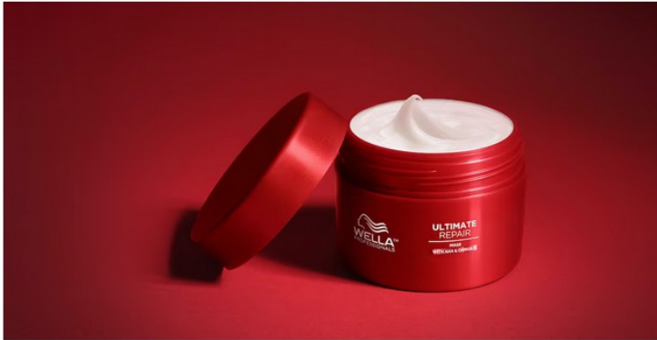
Ultimate Repair Mask di Wella

Non tutti sanno, però, che le hair mask possono rivelarsi molto utili anche per rinforzare i capelli indeboliti da colorazioni, decolorazioni e dal calore dei tool di styling . In questo caso servono formule ristrutturanti che regalino morbidezza senza appesantire i fusti .