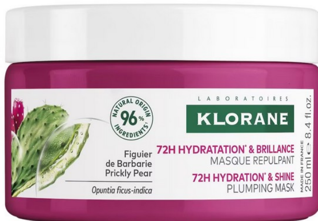
Maschera Rimpolpante di Klorane

Le più generiche maschere idratanti si usano tutto l'anno e sono trasversali. I capelli secchi, infatti, sono tipici dell'estate e di chi li ha ricci, ma non solo. In inverno, il riscaldamento può disidratarli molto, soprattutto se lisci e sottili. Per questo, un paio di volte alla settimana, serve un impacco dissetante a base di acido ialuronico e anguria . «Quest'ultima è altamente idratante ma anche illuminante» spiega la dermatologa Corinna Rigoni, che aggiunge: «Di solito, nei prodotti per capelli viene incorporato l'olio di semi di anguria ristrutturante e protettivo».